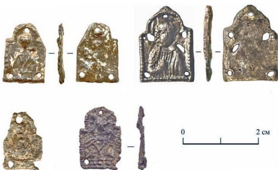
Новгородские подражания паломническим инсигниям.

Оглавление номера можно посмотреть здесь .