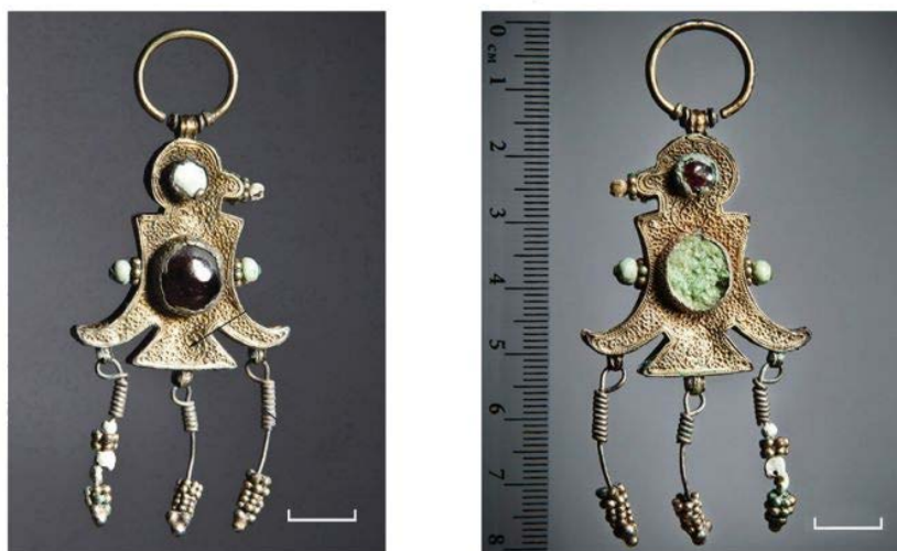
Серьги-голубцы из клада конца XVI – начала XVII века, найденного в Твери в 2011 году.

В 2011 году в Твери на территории земель монастыря Григория Богослова был найден клад женских украшений и фрагментов текстиля с золотым шитьем. Находки датированы XVI – началом XVII века и XVII веком. Художественные особенности изделий позволяют предположить, что часть из них была изготовлена в Новгороде. Рентгено-флюоресцентный анализ поверхности металла показал, что кресты из клада были отлиты из серебряного сплава с небольшим добавлением золота — вероятно, утраченной позолоты. Серьги, из которых состояла основная часть клада, были также изготовлены из серебряного сплава, а высокое содержание ртути и золота указывает на то, что серьги полностью были позолочены с помощью огневого золочения. С результатами исследования можно познакомиться в статье А. В. Вяземского (ИА РАН), Т. А. Левыкиной (ГИМ) «Комплекс женских украшений из Тверского клада 2011 г. („раскоп Трудолюбия-2“) .